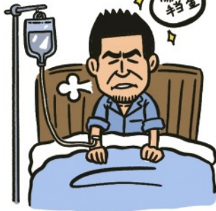
病気や怪我で仕事を休んだ時にもらえる傷病手当