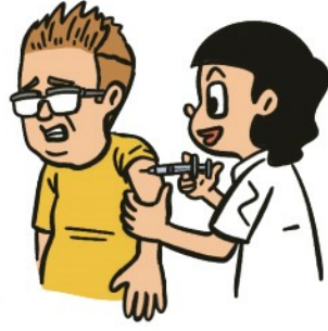
インフル予防接種の助成

建設国保は、市町村国保にはない、組合独自の補助制度や健康を支援する事業を利用することができます。