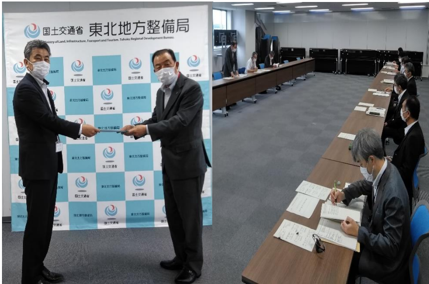
要請書を提出する北東地協会長