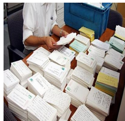
はがき集計の様子

そのため国からの補助金はとても重要で、全国の仲間と共に協力して財務省や厚労省へハガキ要請を行い、補助金確保に向けた運動を展開する必要があります。